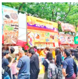
④ペルー料理を片手にラテン音楽のライブを楽しもう※イメージ

④平塚市紅谷町周辺 ☎0463-35-8107 ☒10:00~21:00、9日~20:00 ④観覧無料 ④④平塚駅北口より徒歩2分ほか