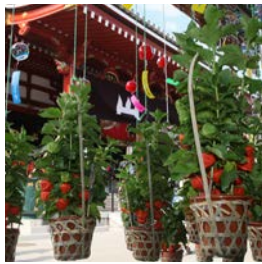
①真っ赤に色付いたホオズギが並び様子は夏の訪れを感じさせる

納豆の日 今日は何の日? 7(なっ)10(とお)の語呂合わせ。関西納豆工業協同組合が納豆の消費拡大を目指して制定。