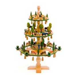
④一つ一つ丁寧に手作りされた木製の動物がのったキュートなツリー

pick up! 「サンシャイン水族館 屋外エリア大規模リニューアル」オープン →P17