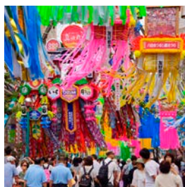
④高さ10mを超える七夕飾りや色とりどりの短冊をつらねた竹は見応え抜群

④渋谷区代々木神園町2-1 ☎03-6692-0939 ☒11:00~20:00 ④入場無料(飲食有料) ④④原宿駅表参道口より徒歩10分 ④oceanpeoples.com/